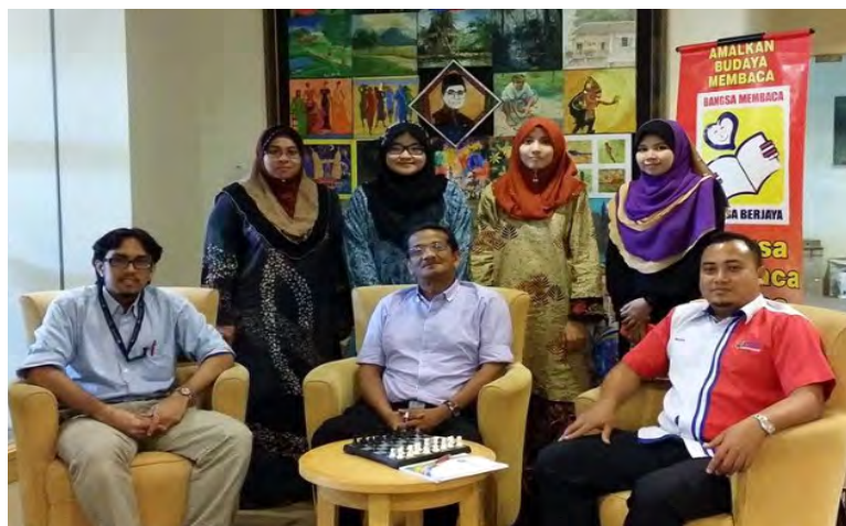
Perdana Leadership Foundation Library staff and Group Members

The author also acted as the Group Leader to organize an educational visit to Perdana Leadership Foundation Library, Putrajaya in May 2014. The objective of the visit was to gain more knowledge and exposure about library management and organization. During the visit, group members were exposed to current technology available and used in the library, educational program, library promotion and marketing.