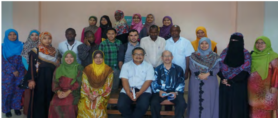
New MLIS students

LISSA organised a ta'aruf session to welcome all new DLIS students. In this program, the committee was introduced and a briefing on the Department, staff and lecturers, program and requirements was given. There was also some knowledge sharing from the lecturers and senior students.