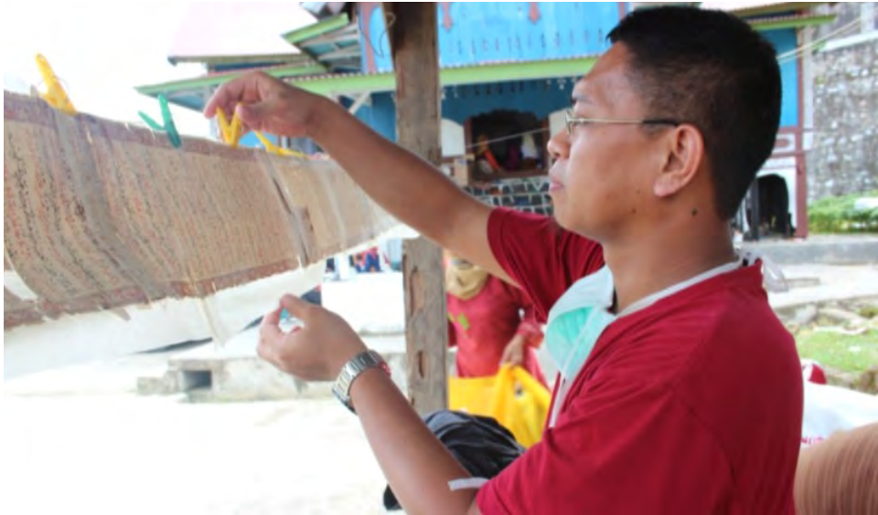
Teknik rawatan Jepun menggunakan udara semulajadi untuk pengeringan manuskrip