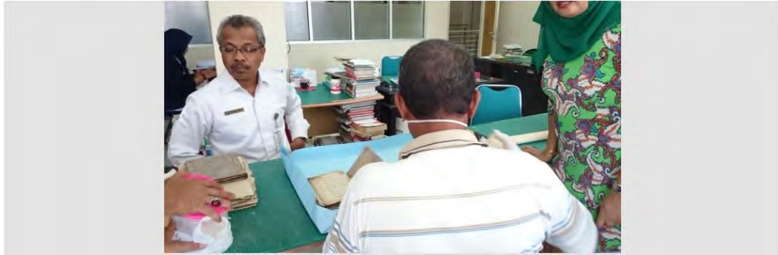
Dua orang pakar dari Universiti Malaya Kuala Lumpur mengadakan workshop singkat di BPA Sumbar. (Istimewa)

Oleh Elvia Mawarni pada Rabu, 25 Mei 2016 jam 12:30:30 WIB