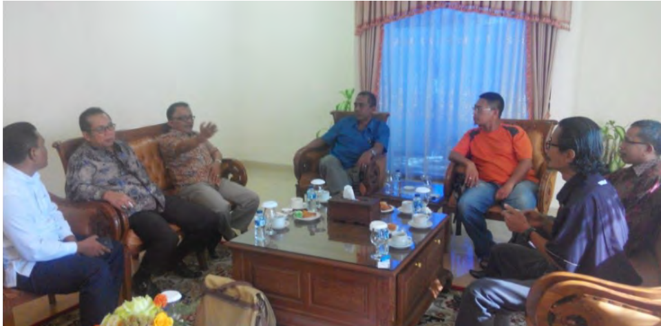
Pertemuan bersama kepala pustaka dan para pensyarah UNAND di bangunan VIP, Bandara Internasional Minangkabau.