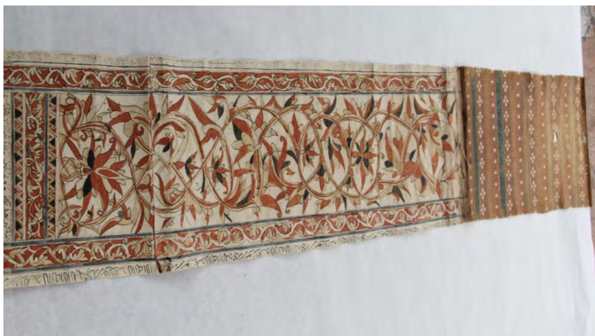
Khutbah gulung dan surat wasiat dengan iluminasi yang unik