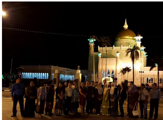
AUNILO members' night out