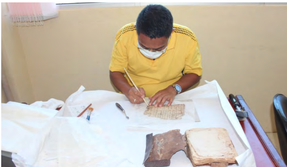
Proses meluruskan bahagian helaian manuskrip menggunakan tulang ikan paus