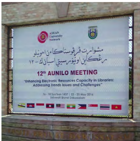
UBD welcoming the AUNILO members

The Business Meeting commenced on 28 May 2016 and ended with presentation of tokens of appreciation. The members were then taken on a tour to the Sultan Haji Hassanal Bolkhiah Islamic Exhibition Gallery, Perpustakaan Islam BDS and the Brunei Arts and Handicrafts Centre.