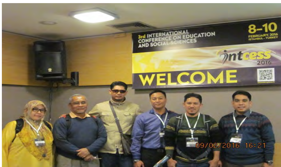
Presenter with participant from Malaysia