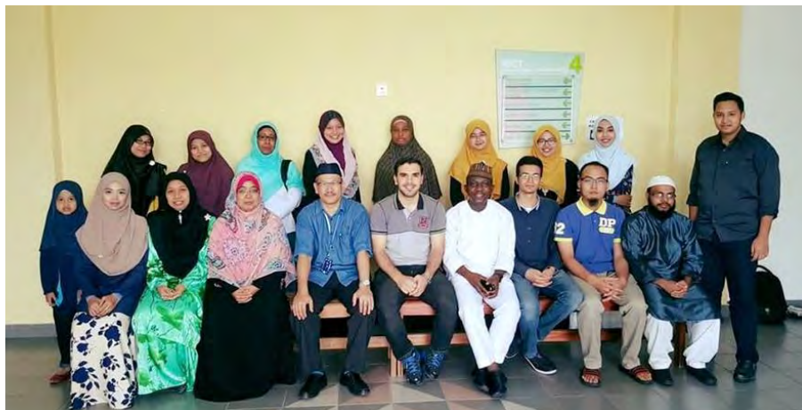
LISSA Committee for 2016/2017

LISSA is an active student assembly in KICT. Every year, they will appoint new members to be part of the LISSA family. At the 2016 AGM meeting, the author was appointed as the Vice President for the 2016/2017 session.