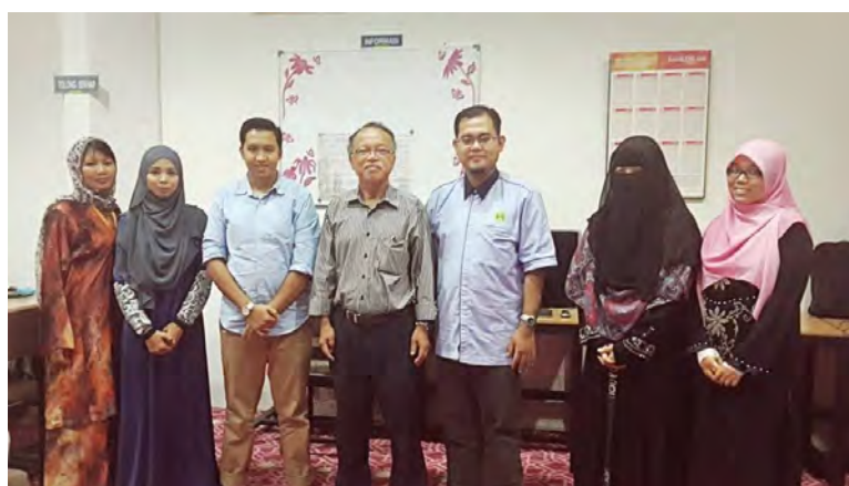
MLIS students with Imam of Masjid Sultan Salahudin Abdul Aziz Shah, Shah Alam

A visit to a mosque library was arranged to fulfil the requirement for the Management for Information Institution subject. Two mosque libraries were involved namely Masjid Sultan Salahudin Abdul Aziz Shah, Shah Alam and Masjid Putrajaya. The students need to identify the mosque library systems, management process, budget, income, and also their activities. The visit gave new experience and knowledge regarding the development of mosque libraries in Malaysia.