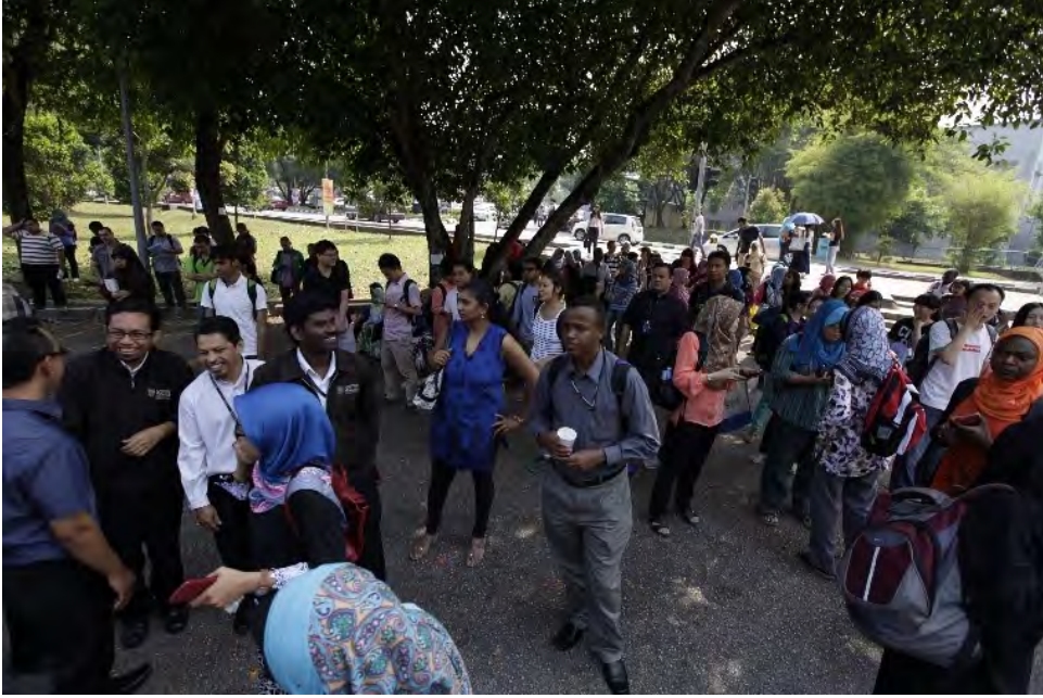
Staf dan pengguna keluar dari bangunan dan menuju ke tempat berkumpul