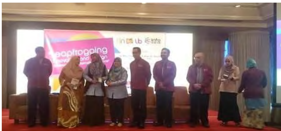
Wakil peserta dari Perpustakaan menerima pingat perak bagi kategori Inovasi melalui ruang fizikal : CoLA