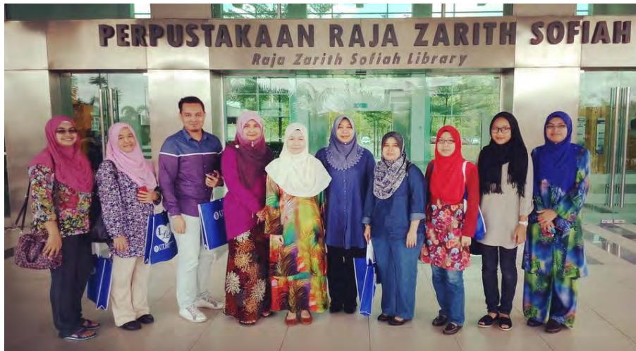
Peserta bersama pustakawan Perpustakaan Raja Zarith Sofiah, UTM

Untuk aktiviti santai, rombongan telah berkunjung ke Universal Studios, Merlion Park dan SEA Aquarium Sentosa. Sebelum bertolak pulang, rombongan ini telah singgah ke UTM untuk melihat Perpustakaan baru mereka.