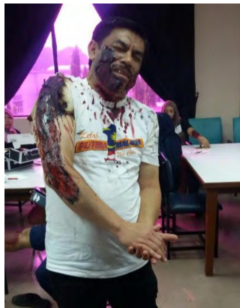
Staf yang memainkan peranan sebagai mangsa