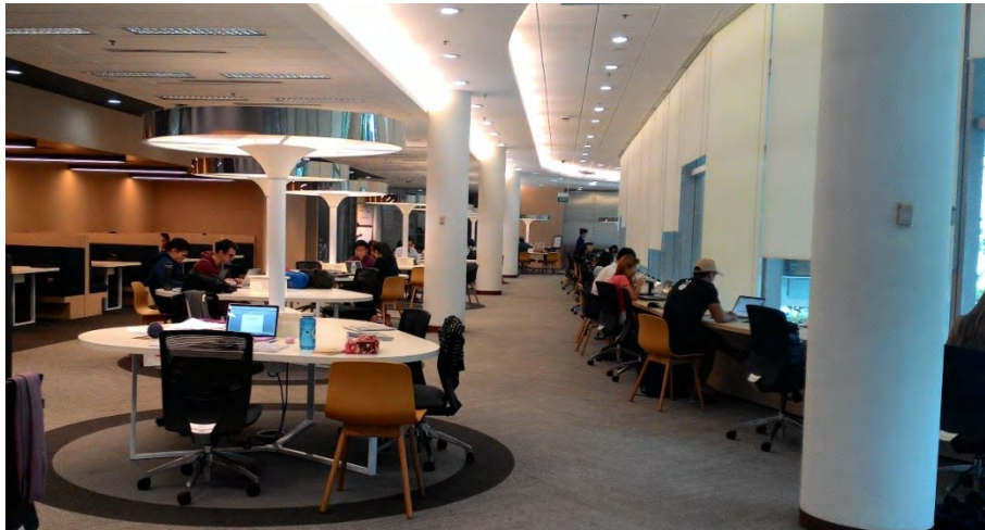
Persekitaran Perpustakaan SMU yang menarik dan direkabentuk khas untuk aktiviti pembelajaran yang kondusif dan ceria