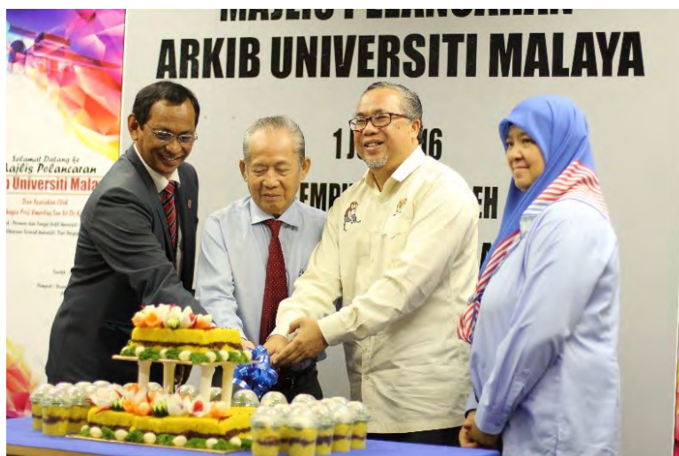
Acara memotong pulut kuning, simbolik pelancaran Arkib UM

Perpustakaan turut mengadakan pameran poster yang bertemakan sejarah Universiti Malaya. Selain daripada itu, New Straits Times Press (Malaysia) Berhad juga turut diundang sebagai pempamer bagi memeriahkan majlis yang diadakan.