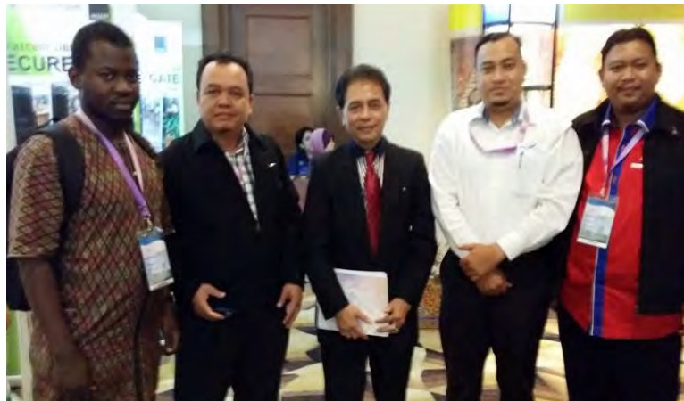
WCOMLIS 2014 participants