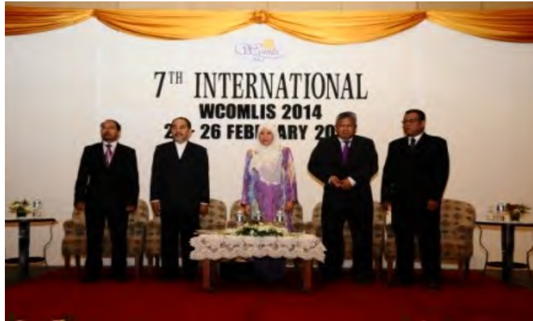
Opening ceremony of WCOMLIS 2014

services, knowledge management and records management. The theme of the Congress was 'Information Governance: Trends, Challenges and Future' .