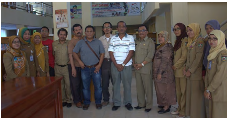
Bergambar bersama Kepala Kantor Pustaka Sijunjung dan tim konservasi Pustaka Calau