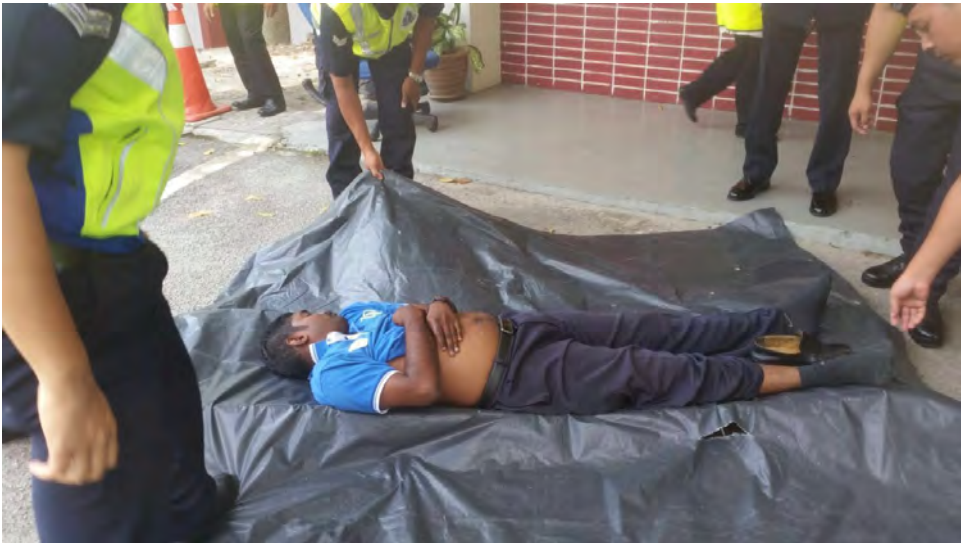
Salah seorang mangsa maut dikeluarkan dari bangunan Perpustakaan ke tempat berkumpul.