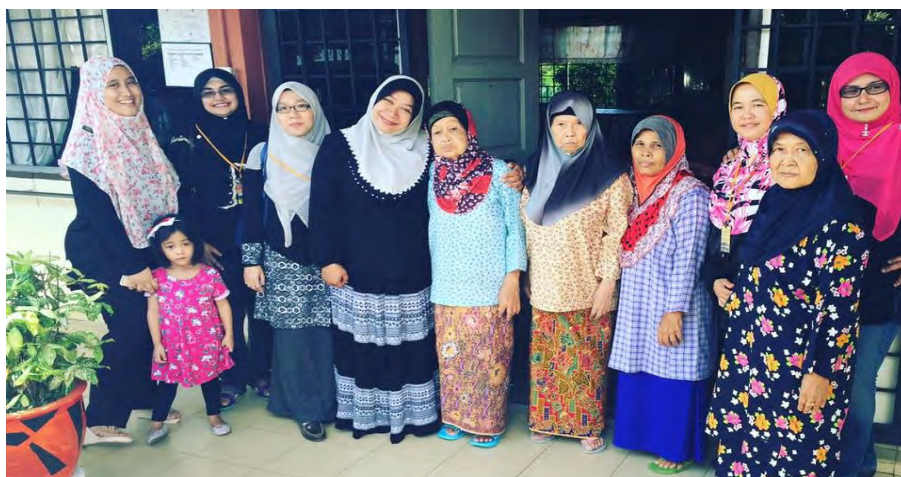
Peserta bersama penghuni Rumah Seri Kenangan Cheng, Melaka

Bertemakan Amal, Akademik dan Santai, AJK Ikhtisas telah menganjurkan satu program berbentuk lawatan ke Singapura pada 4 hingga 7 Mac 2016. Dalam perjalanan menuju ke destinasi, rombongan ini telah sempat berkunjung ke Rumah Seri Kenangan Cheng, Melaka (Rumah Orang Tua & OKU) dan mengedarkan minuman petang bagi penghuni di sini. Selepas bermalam di Johor Bahru, perjalanan diteruskan ke Kota Singa pada keesokan harinya.