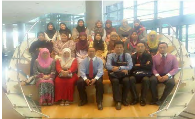
Academic visit at the Knowledge Management Center, Sasana Kijang, Bank Negara Malaysia

experiences of the organization. The visit also focused on the organization management, strategic planning and human resources management.