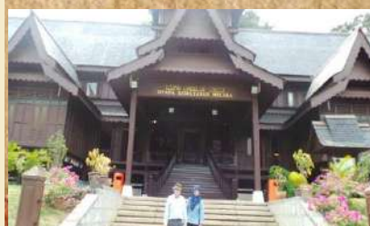
Dihadapan Muzium Melaka