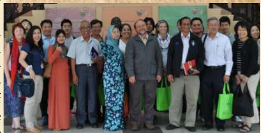
Participants from Drew University at APM