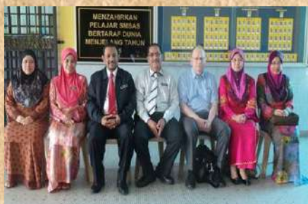
Sesi bergambar bersama para guru