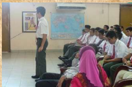
Sesi soal jawab

18 Mac 2013, bertempat di Dewan Besar ASiS. SM Sains Alam Shah, Kuala Lumpur