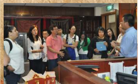
Participants at APM