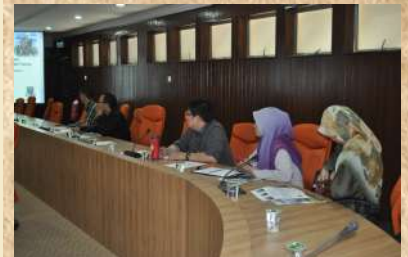
Some of the audiens