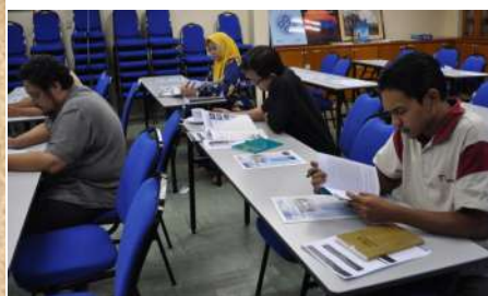
Diantara peserta yang hadir

dengan dwi-nisbah perkongsian mampu diguna pakai berdasarkan keputusan empirik yang diperolehi dan rumus penentuan nisbah perkongsian yang berketentuan dan tak berkentuan berjaya dibangunkan dengan kaedah analitik.