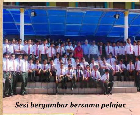
Sesi bergambar bersama pelajar

Itu adalah antara refleksi yang dapat dicerna daripada pembentangan pada hari tersebut. Ia perlu diamati dan diinsafi untuk memastikan survival Bahasa Melayu bukan sahaja di bumi asing tetap kukuh tetapi subur mekar di bumi sendiri (Malaysia)