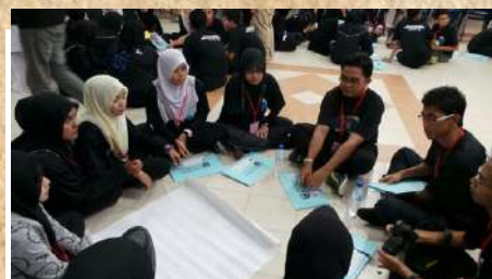
Kerjasama dalam kumpulan

Para pelajar telah melakukan beberapa aktiviti yang telah dirancang dengan baik untuk mencapai objektif penganjuran bersama yang berbentuk indoor mahupun outdoor . Program ini dapat mencetuskan kesedaran dan motivasi dalam kalangan para peserta untuk mempertingkatkan kesungguhan dalam menuntut ilmu di bangku sekolah seterusnya memperolehi keputusan yang cemerlang untuk membuka peluang melanjutkan pelajaran ke peringkat yang lebih tinggi. Di samping itu, program ini juga dapat memberi impak positif kepada pertumbuhan kemahiran insaniah yang seharusnya dimiliki oleh setiap mahasiswa mahupun bakal mahasiswa apatah lagi menjadi mahasiswa di universiti premier Negara seperti Universiti Malaya ini. Ia juga selaras dengan tema Kolej Kediaman Tuanku Kurshiah (KKTK), 'Kurshiah Penjana Transformasi Negara'.