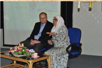
Question and answer session