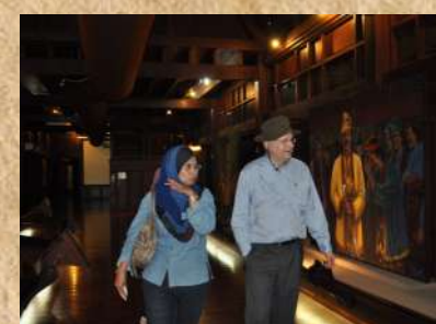
Lawatan ke Muzium Melaka