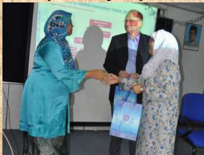
Prof and moderator receiving token