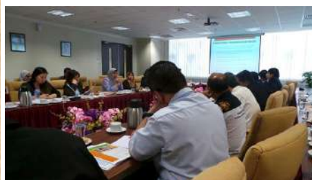
Ahli-ahli daripada 13 IPTA dan politeknik yang terlibat