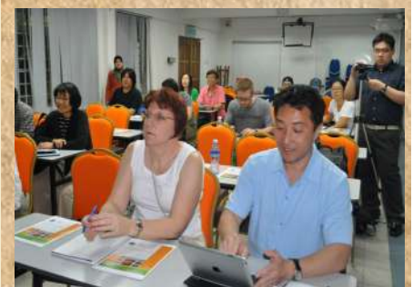
Participants listening to speaker