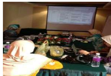
Suasana di dalam dewan seminar

Selain itu, di dalam bengkel ini dibincangkan kembali carta "Gantt" untuk disesuaikan kembali mengikut waktu kelapangan ahli-ahli yang terlibat. Kami juga membincangkan aktiviti dan pengisisan utama sewaktu sesi taklimat kepada guru-guru sekolah nanti. Hasil daripada bengkel ini kami berjaya menghasilkan sebuah modul yang mempunyai enam bab yang komprehensif berkaitan dengan Penyeliaan Kembang Tumbuh.