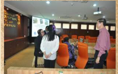
Discussion before public lecture