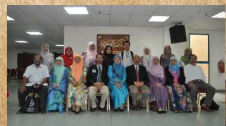
Peserta bergambar selepas syarahan