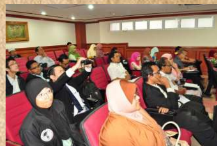
Peserta yang hadir

tingkah laku manusia yang secara langsung berkaitan dengan rahsia Ilahi yang tidak difahami oleh manusia