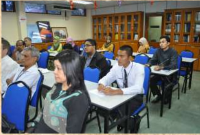
participants listen carefully to the public lecture

20 March 2013 at Katha Room, Centre for Civilisational Dialogue, UM