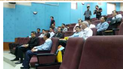
Sebahagian peserta yang hadir

telah merasmikan majlis ini dan mengalu-alukan kedatangan pelajar-pelajar baru ini dan mengharapkan mereka akan memberi komitmen yang tinggi dalam menghadapi sesi pembelajaran yang agak komprehensif dengan jayanya. Memandangkan guru besar yang telah diterima sebagai pelajar ini juga harus bekerja. Beberapa aktiviti telah dilaksanakan untuk pelajar-pelajar baru yang bermatlamatkan kepada memberi kesediaan mental dan fizikal kepada semua pelajar sesi 2013-2015.