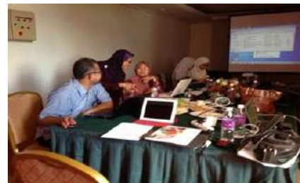
Bengkel dan perkongsian ilmu