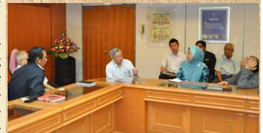
Meeting with APM staff

Overall, the public lecture was successful and it was attended by approximately 30 participants.