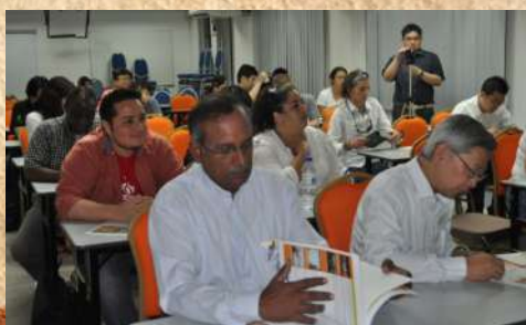
Participants from Drew University